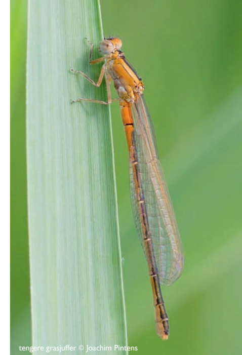
tengere grasjuffer