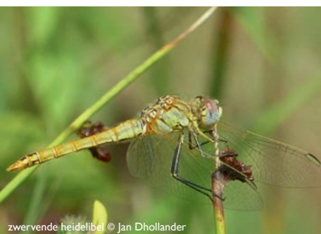
Zwervende heidelibel