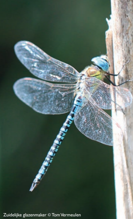
Zuidelijke glazenmaker © Tom Vermeulen

waarneming van een soort op een bepaalde dag op een bepaalde plaats door een waarnemer