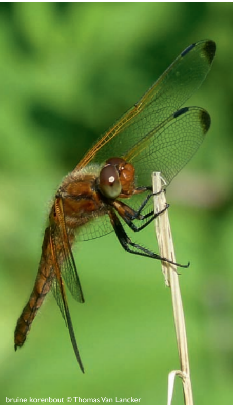
bruine korenbout