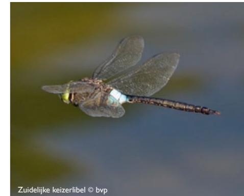
Zuidelijke keizerlibel