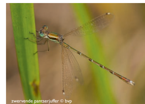
Zwervende pantserjuffer