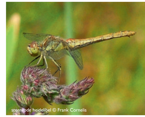
steenrode heidelibel © Frank Cornelis