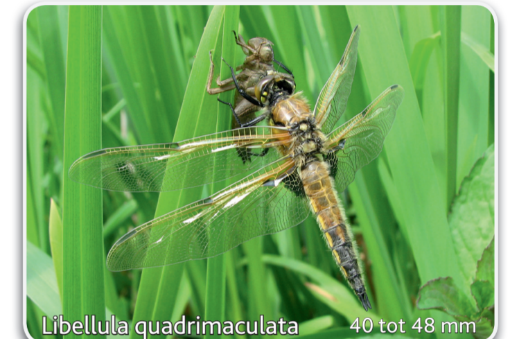
Libellula quadrimaculata 40 tot 48 mm Viervlek