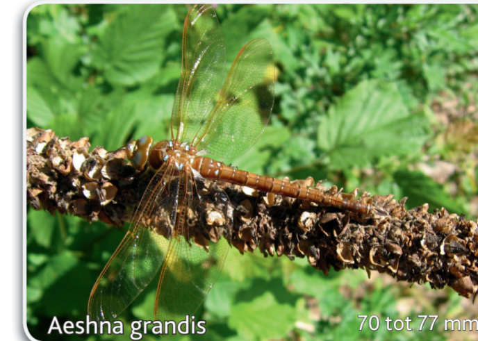
Aeshna grandis 70 tot 77 mm Bruine glazenmaker