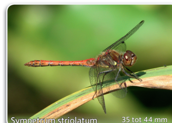
Sympetrum striolatum 35 tot 44 mm Bruinrode heidelibel