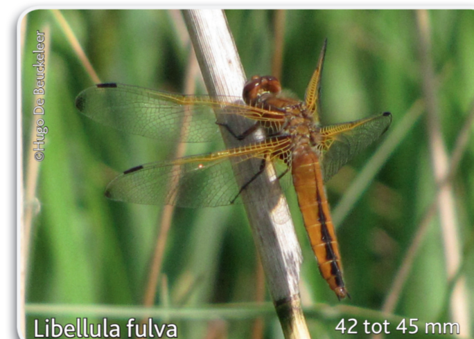
Libellula fulva 42 tot 45 mm Bruine korenbout ♀