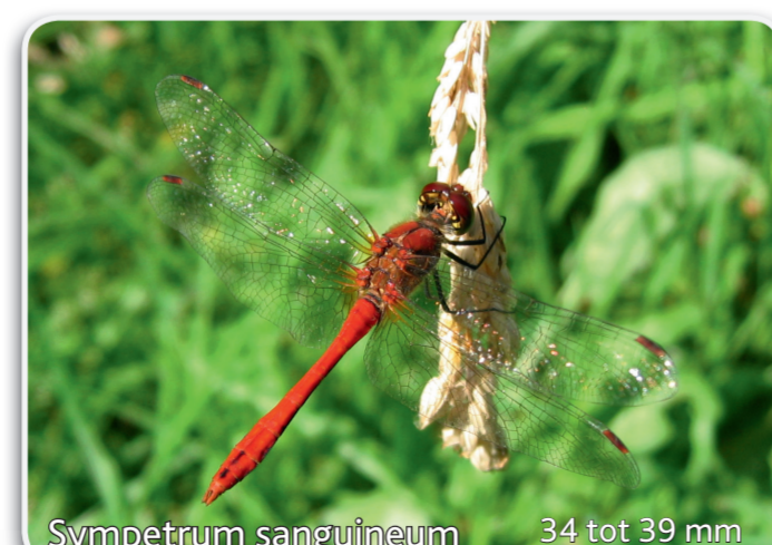
Sympetrum sanguineum 34 tot 39 mm Bloedrode heidelibel