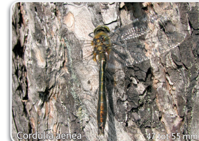
Cordulia aenea 47 tot 55 mm Smaragdlibel