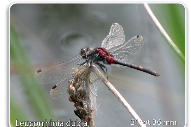
Leucorrhinia dubia 31 tot 36 mm Venwitsnuitlibel