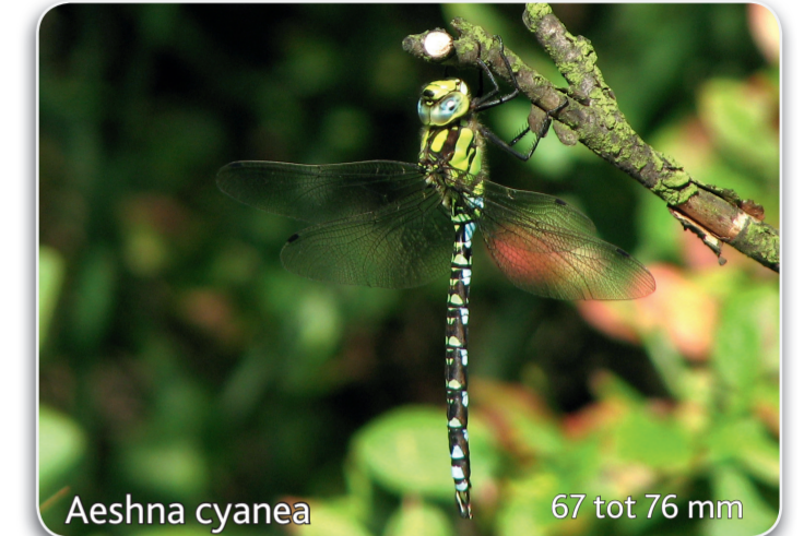
Aeshna cyanea 67 tot 76 mm Blauwe glazenmaker