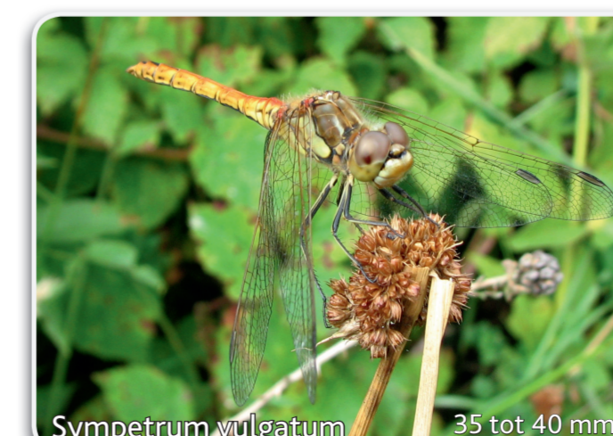
Sympetrum vulgatum 35 tot 40 mm Steenrode heidelibel