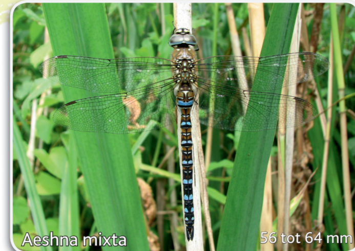
Aeshna mixta 55 tot 64 mm Paardenbijter