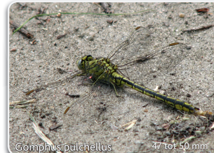
Gomphus pulchellus 47 tot 50 mm Plasrombout