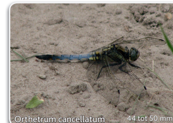
Orthetrum cancellatum 44 tot 50 mm Gewone oeverlibel