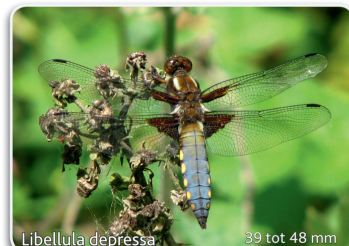
Libellula depressa 39 tot 48 mm Platbuik