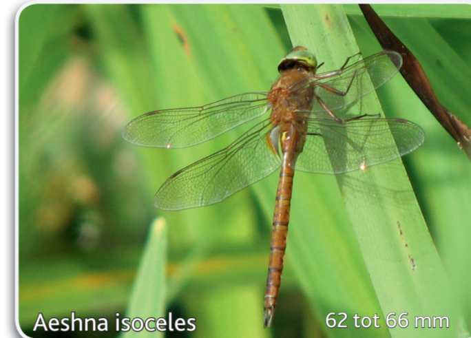
Aeshna isocetes 62 tot 66 mm Vroege glazenmaker