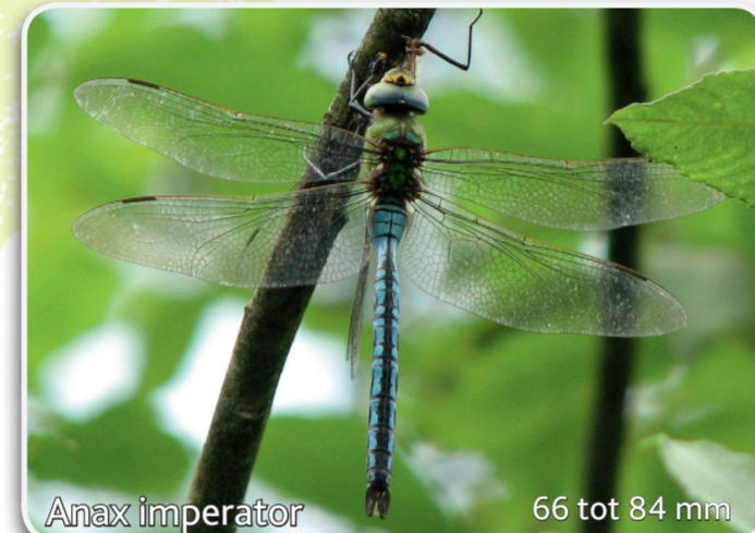
Anax imperator 66 tot 84 mm Grote keizerlibel