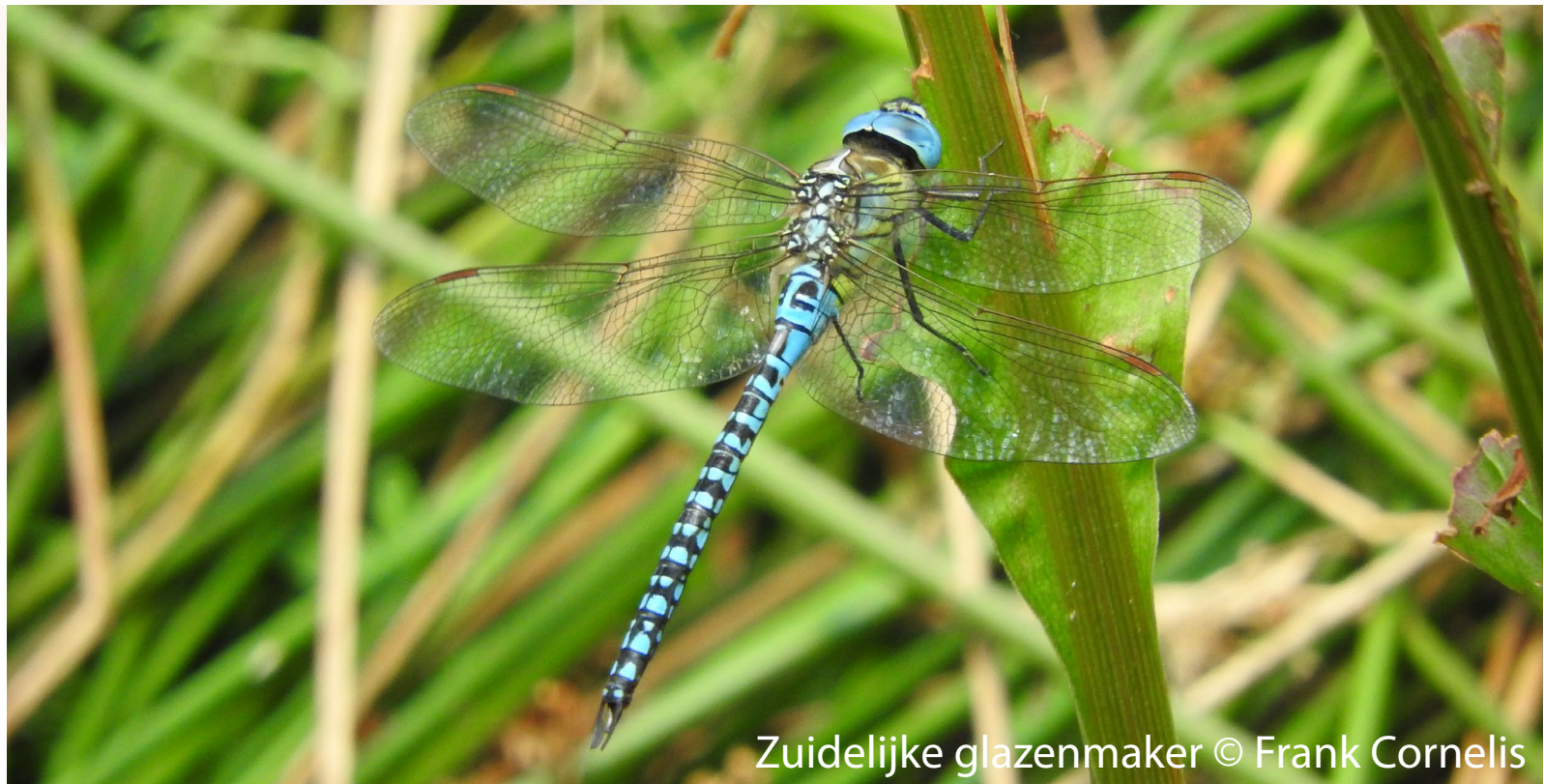
Zuidelijke glazenmaker