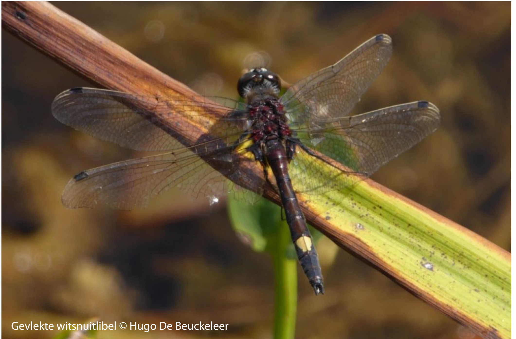
Gevlekte witsnuitlibel