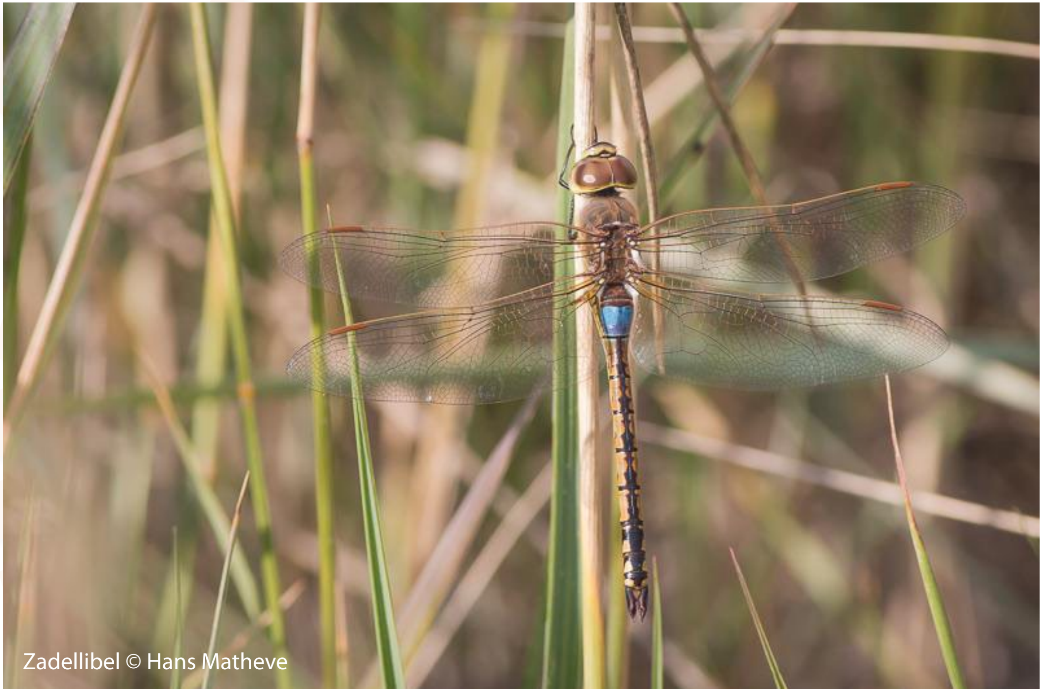
Zadellibel © Hans Matheve