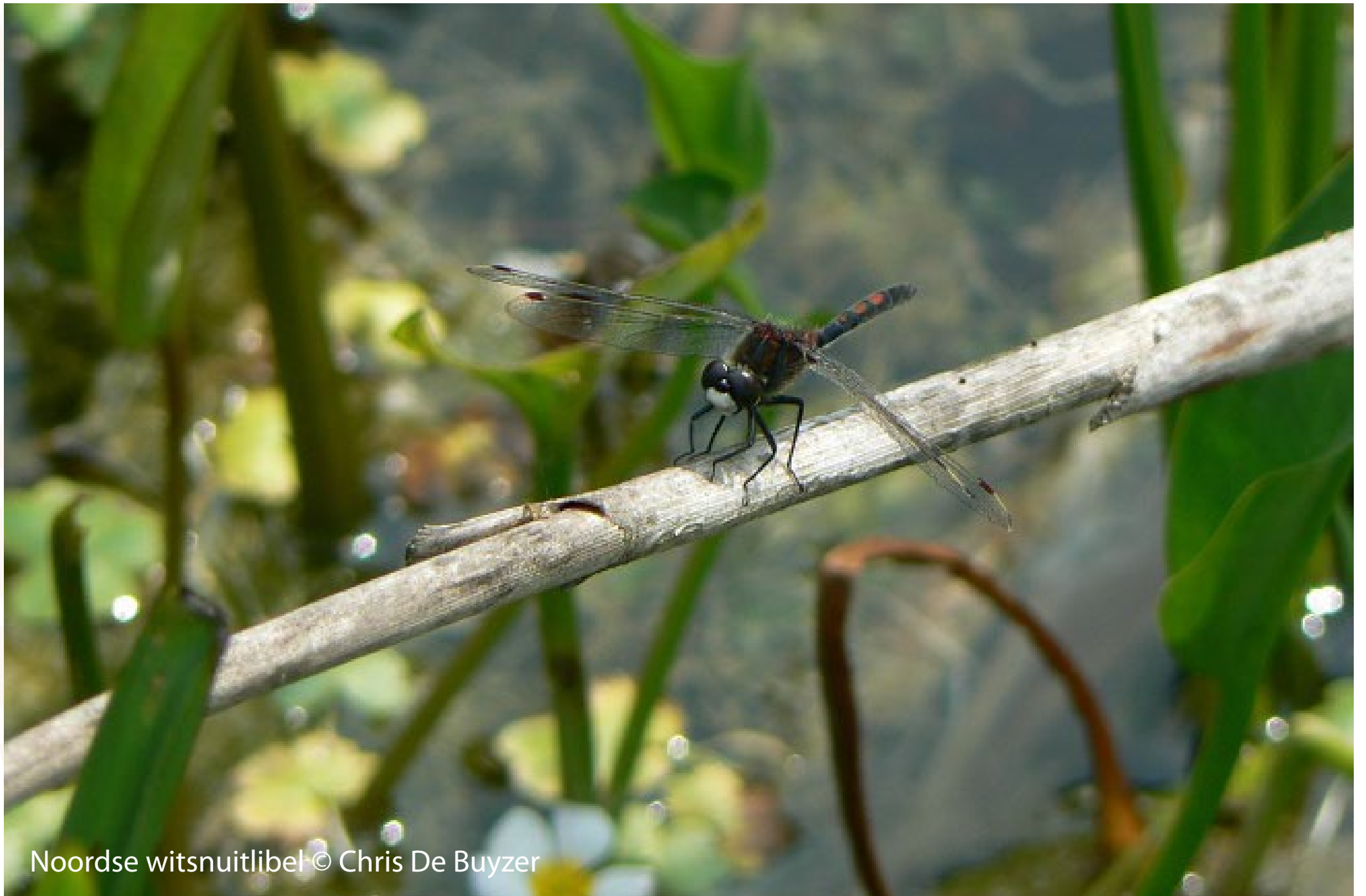
Noordse witsnuitlibel