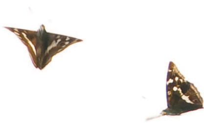
Uit het territoriaal gedrag van twee mannetjes kon geconcludeerd worden dat het bosgebied een (kleine) populatie herbergt.

In de Ecologische Atlas van de dagvlinders van F.A. Bink lezen we het volgende: "De grote weerschijnvlinder komt vooral bij open plekken in bossen of in complexen van samenhangende bossen in beekdalen, waarin wilgen in de halfschaduw groeien en enkele grote, landschappelijk opvallende bomen staan." Zo kan de soort gehanteerd worden als een indicator van landschapskwaliteit .