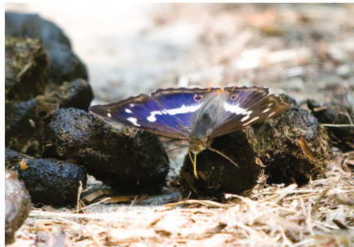
Grote weerschijnvlinders zijn regelmatig op mest te zien wat voor hen absoluut noodzakelijk is om mineralen op te nemen.